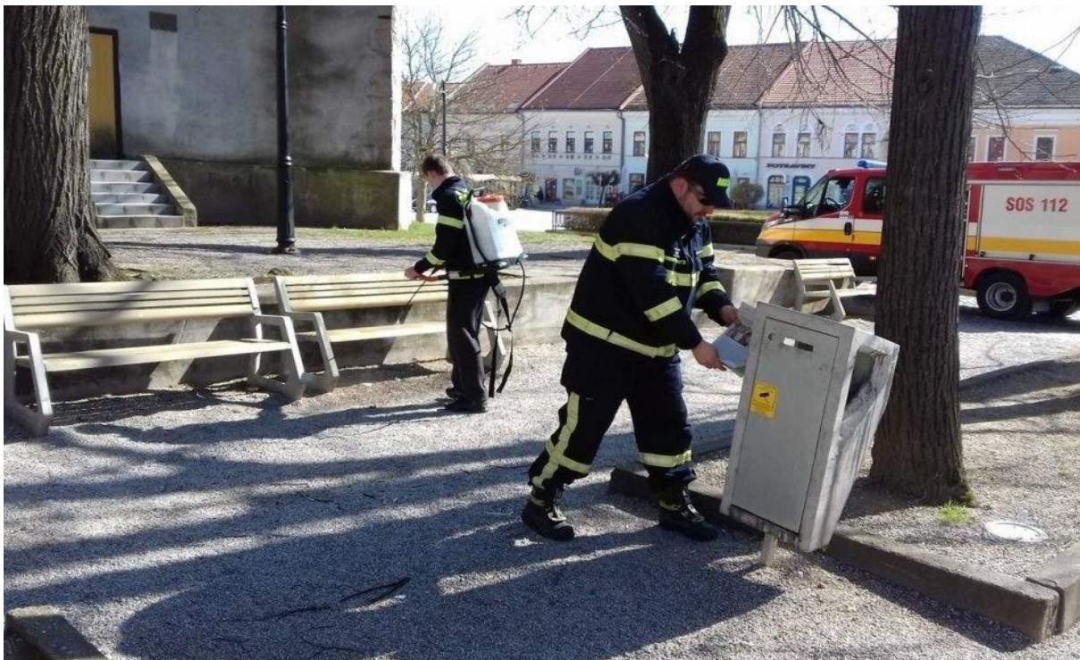
Dobrovoľní hasiči dezinfikujú park na Námestí baníkov