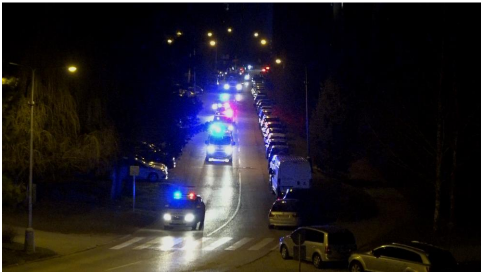
Vozidlá záchranej a bezpečnostnej zložky so zapnutými sirénami

Mesto Rožňava dňa 31. 3. 2020 o 20.00 hod. za spolupráce všetkých občanov Rožňavy uskutočnilo najkrajšiu a najväčšiu ĎAKOVAČKU pre všetkých tých, ktorí v týchto ťažkých časoch chodili do práce a riskovali svoje životy pre všetkých obyvateľov mesta a jeho okolia. Program začal o 19.56 hod., keď moderátor vyzval Rožňavčanov zhasnúť všetky svetlá v bytoch, následne o 19.58 hod. vyšli na balkóny a okná s mobilmi, zapalovačmi alebo sviečkami. Po spustení hudby obyvatelia mesta zapli mobily a rôzne svetielka a mesto sa rozžiarilo. Po ukončení hudby nasledoval obrovský potlesk pre hrdinov v prvej línii a nasledovalo prekvapenie. Tlieskajúcim Rožňavčanom sa prišli na vozidlách s majákmi poďakovať všetky záchranné zložky aj policajti. Tí brázdili ulice mesta a prešli po každom sídlisku.