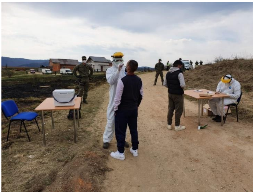
Testovanie sa realizovalo aj v blízkosti osád

Situácia, v ktorej boli nielen svedkami, ale predovšetkým priamymi účastníkmi, vyžadovala od všetkých vojakov mnoho energie, kooperácie a vzájomnej podpory. Všetky doteraz prijaté opatrenia súvisiace s ohrozením vírusom COVID-19 majú svoje opodstatnenia a vychádzajú z potrieb, ktoré si súčasné okolnosti vyžadujú. Na ich plnenie boli každodenne nasadzovaní aj profesionálni vojaci posádky Rožňava.