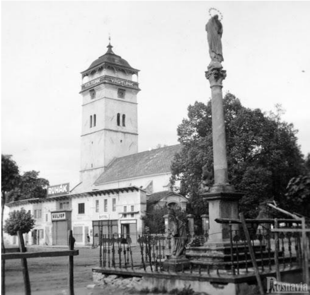
Morový stĺp v minulosti